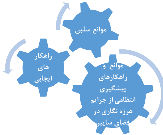
شکل شماره ۲. مضامین تشکیل‌دهنده موانع و راهکارهای پیشگیری انتظامی از جرایم هرزه‌نگاری در سایبر

بر اساس یافته‌های پژوهش و با تحلیل مضامین بدست آمده تعداد ۸ مضمون اصلی و ۶۵ مضمون فرعی بدست آمد که در نهایت در دو مضمون کلی چالش‌های سلبی و سیاست‌های ایجابی دسته‌بندی گردید.